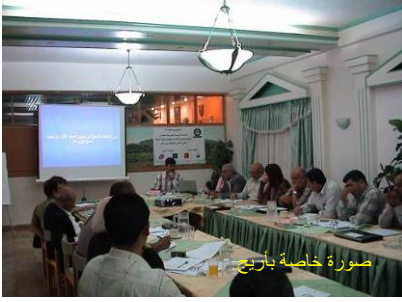
لقاء التوعية المتخصص الثالث الذي عقد في 10 أيار 2006

تنظيم ورشة عمل دولية بمشاركة ممثلين عن بلديات ومؤسسات دولية لديها التزام نحو تحقيق تنمية مستدامة وتطوير جدول أعمال محلي للقرن 21 هي: بلدية روما 11 (إيطاليا)، هيئة تنسيق المبادرات الإيطالية حول جدول الأعمال المحلي للقرن 21 (إيطاليا)، جامعة مالطا (مالطا)، وشبكة الديمقراطية والتنمية المحلية في الإكوادور (الإكوادور).