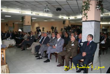
المؤتمر النهائي للمشروع