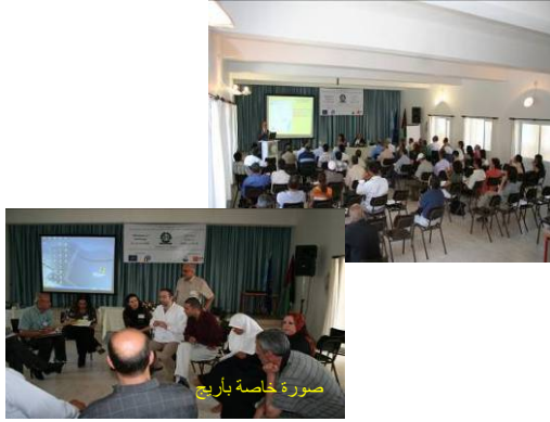
ورشة العمل الدولية "ورشة عمل بيت لحم 21" التي نظمت في 28 و29 حزيران 2006

تنظيم لقاءات توعية متخصصة تناولت عدة مواضيع هي: التنمية الاقتصادية والاجتماعية، الإدارة المستدامة لمصادر المياه، الزراعة المستدامة، الإدارة المستدامة للأراضي والإدارة المستدامة للمياه العادمة والنفايات الصلبة.